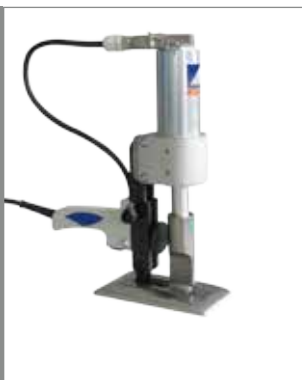
Coupe manuelle droite

Appareils manuels pour la réalisation de petites ou moyennes séries :