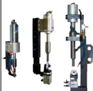
Coupe ou soudeuse sur ligne

Gamme de générateurs : Tous nos appareils sont fournis avec un générateur adapté (de 75 à 1 200 W - 30 ou 20 kHz)